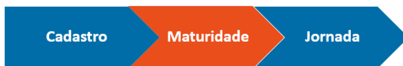
Fluxograma macro das etapas do programa para ferramentarias.

As empresas elegíveis serão contatadas pelo programa após seleção por esta chamada. As participações nas etapas de cadastro, avaliação de maturidade e posteriormente da jornada, são obrigatórias e seguirão conforme os requisitos abaixo.